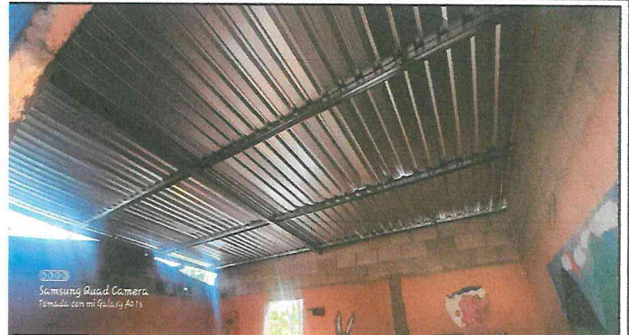
Foto 2: mejoramiento de estructura y techo de un salón de clases.