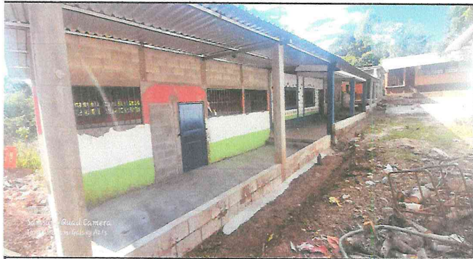
Foto 3: Instalación de puerta y balcones de metal en salón de clases.