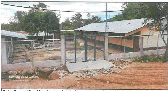
Foto 5: sustitución de portón de ingreso y mejoramiento de circulado del perímetro.