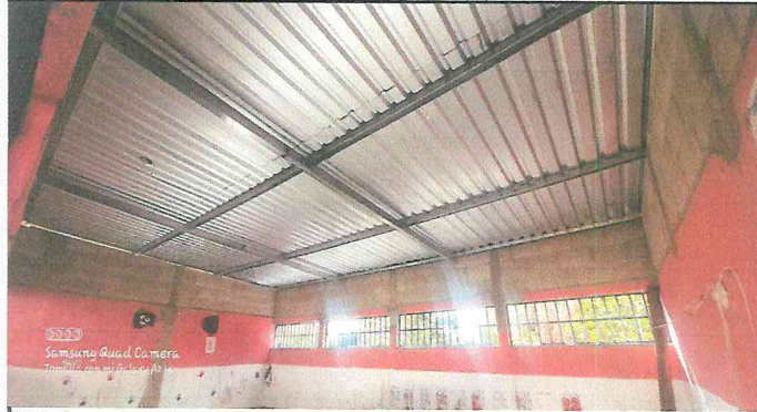
Foto 1: mejoramiento de estructura y techo de un salón de clases.